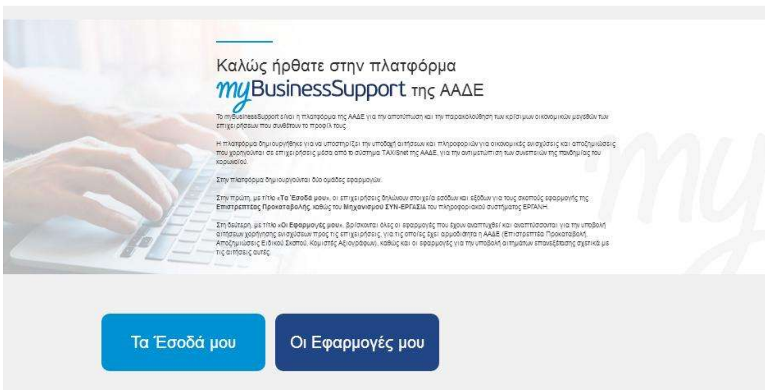
Εικόνα 1: Σελίδα της εφαρμογής στον διαδικτυακό τόπο της ΑΑΔΕ

Η σελίδα της εφαρμογής στο διαδικτυακό τόπο της Α.Α.Δ.Ε. είναι η παρακάτω. Για την είσοδο ο ενδιαφερόμενος επιλέγει «Οι εφαρμογές μου» και στη συνέχεια «ΑΞΙΟΓΡΑΦΑ»