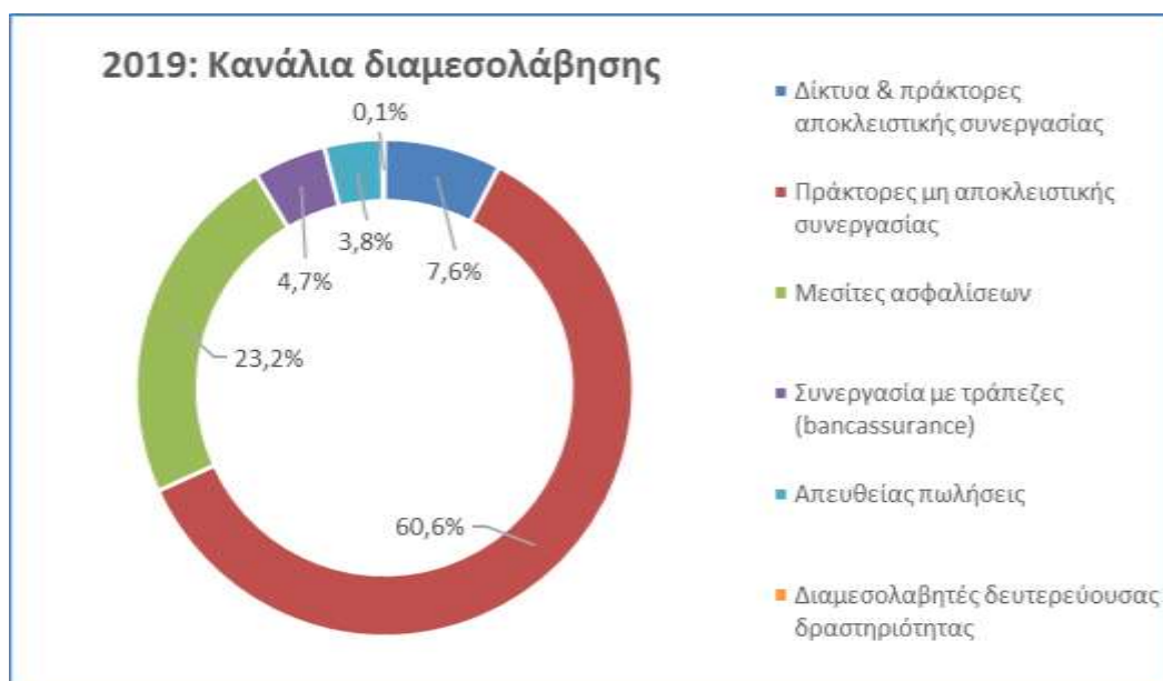
Γράφημα 1: Κανάλια διαμεσολάβησης – ποσοστιαία συμμετοχή

Η ποσοστιαία συμμετοχή του συνόλου των καναλιών διαμεσολάβησης, σύμφωνα με τις απαντήσεις των ασφαλιστικών επιχειρήσεων – μελών που συμμετείχαν στην έρευνα, εμφανίζεται στο γράφημα που ακολουθεί.