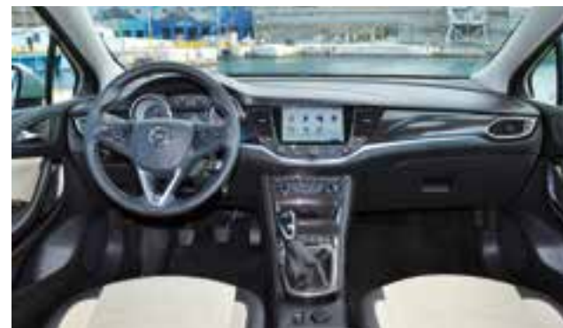
Η ποιότητα κατασκευής είναι πολύ καλή, όπως και η συναρμογή, ενώ στην κεντρική κονσόλα ξεχωρίζει η οθόνη του συστήματος infotainment

Ανάλογα με την εξοπλιστική έκδοση που θα επιλέξετε το Astra, θα έχετε τη δυνατότητα να το απολαύσετε, με πλούσιο εξοπλισμό άνεσης και ασφάλειας, όπως το Σύστημα Αναγνώρισης Οδικής Σήμανσης και το Σύστημα Διατήρησης Λωρίδας Κυκλοφορίας με Προειδοποίηση Αλλαγής Λωρίδας Οχήματος μαζί με την Ένδειξη Απόστασης Προπορευόμενου Οχήματος και το Σύστημα Αναγνώρισης Επικείμενης Σύγκρουσης με Φρενάρισμα Επικείμενης Σύγκρουσης. Αυτό όμως που μας εντυπωσίασε είναι το Advanced Park Assist, το οποίο προσφέρει τη δυνατότητα στο Astra να παρκάρι αυτόματα με το πάτημα ενός κουμπιού, μόλις