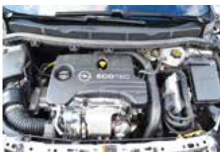
Ο 1.000αρης Ecotec αποδίδει 105 ίππους και 170 Nm ροπής, η οποία είναι διαθέσιμη από τις 1.800 σ.α.λ. Η λειτουργία του είναι πολιτισμένη και ραφιναρισμένη, με τη δύναμη να αποδίδεται αρκετά γραμμικά