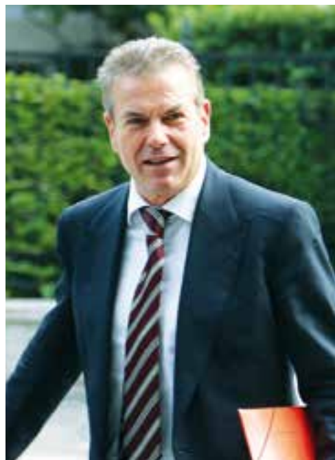
Ο υφυπουργός Κοινωνικής Ασφάλισης κ. Τάσος Πετρόπουλος

Εισφορές μισθωτού 9.22% (6.67% για σύνταξη και 2.55% για περίθαλψη) θα καταβάλλει ο αμειβόμενος με μπλοκάκι σε έως δύο εργοδότες μετά την άρνηση του εργοδότη να συμμετάσχει στο ασφάλιστρο έως ότου ο ΕΦΚΑ λύσει την εργατική διαφορά όπως προβλέπει η εγκύκλιος του υπουργείου Εργασίας.