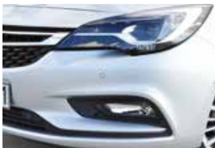
Το IntelliLux LED, το σύστημα full-LED matrix light της Opel προσφέρει οδήγηση με μεγάλη σκάλα φωτών που δεν ενοχλεί τους άλλους οδηγούς

Ο λεβιές ταχυτήτων έχει καλό κούμπωμα, αλλά δεν σας κρύβουμε ότι το τιμόνι θα το θέλαμε να μεταφέρει ελαφρώς περισσότερη πληροφόρηση. Γενικά όμως, ακόμα και από την πρώτη επαφή το Astra 1,0 σε κάνει να αισθάνεσαι άνετα και ασφάλεια