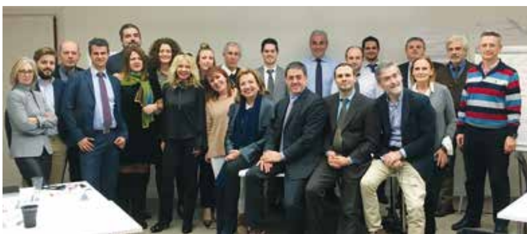
Στιγμιότυπο από την εκπαίδευση εξειδικευμένων συνεργατών για το Capital SAVE

Ειδικότερα ως προς το επενδυτικό σκέλος, χρησιμοποιείται η πλατφόρμα ανοικτής αρχιτεκτονικής του Capital με πληθώρα αμοιβαίων κεφαλαίων, από τα οποία υπάρχει η δυνατότητα ελεύθερης επιλογής κατά την έκδοση και κατά την αλλαγή επενδυτικής πολιτικής, που μπορεί να πραγματοποιηθεί οποιαδήποτε στιγμή. Στη λήξη του προγράμματος, ο ασφαλισμένος λαμβάνει τον λογαριασμό επένδυσης εφάπαξ ή σε προκαθορισμένες δόσεις.