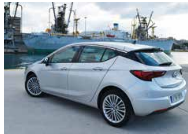
Η 4η γενιά Astra, εμφανίζεται πιο κομψή από ποτέ με αρκετό δυναμισμό και σωστές «αναλογίες».

βρεθεί ο κατάλληλος χώρος. Τέλος, στο Astra της δοκιμής μας υπήρχε το IntelliLux LED, το σύστημα full-LED matrix light της Opel που προσφέρει οδήγηση με μεγάλη σκάλα φωτών που δεν ενοχλεί τους άλλους οδηγούς.