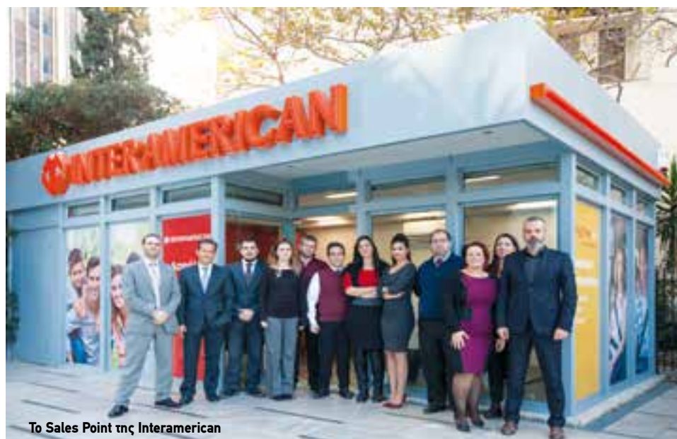
Το Sales Point της Interamerican

ση των λειτουργικών υποδομών και της προηγμένης ψηφιακής υποστήριξης