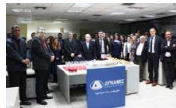
Στιγμιότυπο από την εκδήλωση

Η εμπειρία που απορρέει από τη μακρόχρονη πορεία της Allianz A.E.Δ.Α.Κ στην ελληνική αγορά αποτελεί εγγύηση για την αποτελεσματική διαχείριση των επενδύσεων των πελατών της, σημειώνεται σε σχετική ανακοίνωση.