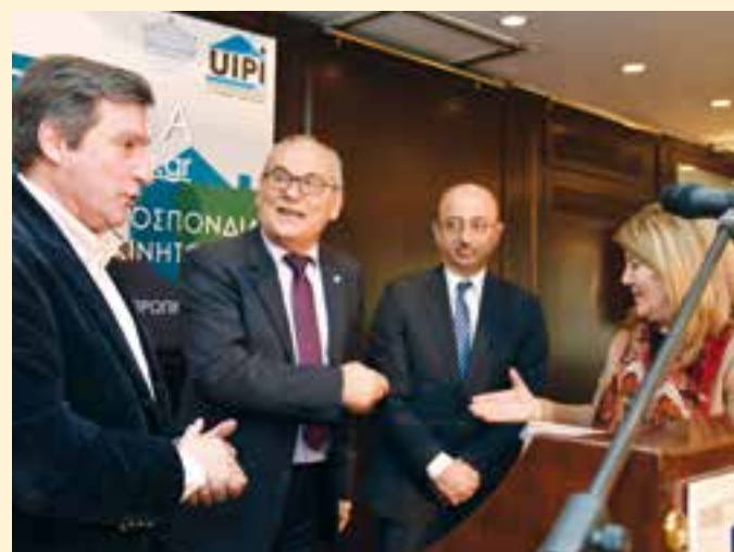
Στιγμιότυπο από την επίδοση της οικονομικής συνδρομής στον Δήμαρχο Αθηναίων, Γ. Καμίνη και την πρόεδρο του ΚΥΑΔΑ, Ε. Κατσούλη, από τον Γ. Ρούντο, διευθυντή δημοσίων σχέσεων και κοινωνικής υπευθυνότητας της Interamerican και τον Σ. Παραδιά, πρόεδρο της ΠΟΜΙΔΑ.