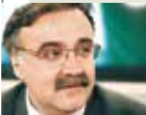
Του Λάμπρου Καραγεώργου

ΤΗΝ ΩΡΑ που γράφονταν αυτές οι γραμμές ένα σήριαλ είχε φθάσει στο τέλος του. Πρόκειται για τη συμφωνία μεταβίβασης του χαρτοφυλακίου των συμβολαίων υγείας –ή ενός μεγάλου μέρους– από την International Life στην Εθνική Ασφαλιστική. Οι πληροφορίες ανέφεραν ότι η συμφωνία έχει επιτευχθεί και θα τεθεί σε ισχύ τυπικά τις επόμενες ημέρες. Θα μπορούσαμε να πούμε τέλος καλό όλα καλά, αν και ποτέ δεν ξέρεις, μέχρι