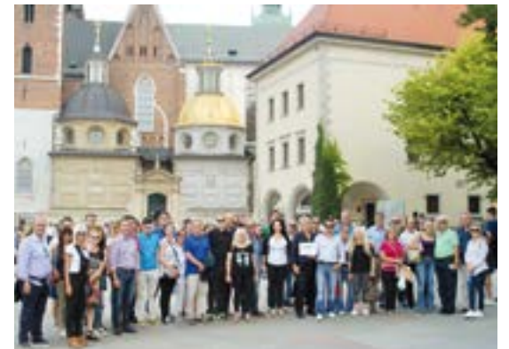
Στιγμιότυπο από το ταξίδι στην Κρακοβία

κόσμηση, με "τόνους" τέχνης, με θησαυρούς γοθτικής και αναγεννησιακής αρχιτεκτονικής, με τη μεγαλύτερη μεσαιωνική πλατεία της Ευρώπης και την Παλιά Πόλη και το κάστρο της Βαβέλ που συγκαταλέγονται και αυτά στα μνημεία της Unesco.