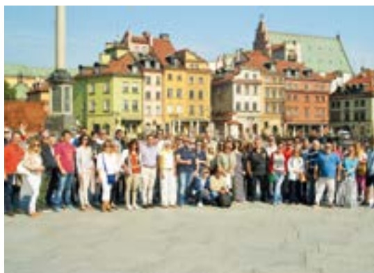
Στιγμιότυπο από το ταξίδι στη Βαρσοβία

Έτσι, η ΑΤΕ Ασφαλιστική επιβράβευσε την αύξηση του χαρτοφυλακίου νέων εργασιών χαρίζοντας στους επιτυγχόντες συνεργάτες της, στις δύο πόλεις-ορόσημα της Πολωνίας ένα μοναδικό ταξίδι 5 ημερών, που μεταξύ άλλων περιλάμβανε περιήγηση στη Βαρσοβία, τη δυναμική πρωτεύουσα της Πολωνίας, με την εκληπτυσμένη Παλιά Πόλη, το παλιό κέντρο που έχει ανακηρυχτεί μνημείο της Unesco, το μοντέρνο κομμάτι της πόλης με τα αμέτρητα καταστήματα, χώρους τέχνης, εξαιρετικά εστιατόρια, καφετέριες και ατελιέ καλλιτεχνών, την εντυπωσιακή Royal Route με τα υπέροχα παλάτια της και ξενάγηση στο Wilanow Palace τη θερινή κατοικία του βασιλιά Jan III Sobiesky. Επίσης επίσκεψη στο Άουσοβιτς, ένα από τα πιο ζωντανά μνημεία και μοναδικό μάθημα ιστορίας και ξενάγηση στην ωραιότερη πόλη της Πολωνίας την Κρακοβία, μια πόλη-