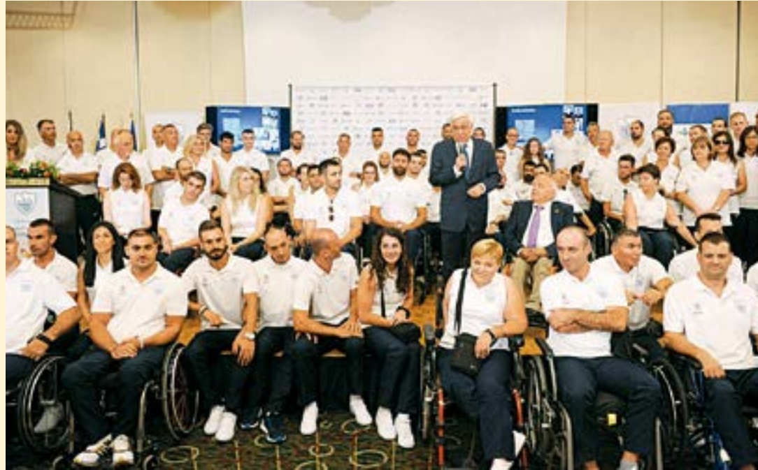
Οι αθλητές και τις αθλήτριες που συμμετέχουν στους Παραολυμπιακούς Αγώνες του Ρίο στην επίσημη παρουσίαση της ομάδας που πραγματοποιήθηκε σε κεντρικό ξενοδοχείο της Αθήνας, παρουσία του Προέδρου της Δημοκρατίας Προκόπη Παυλόπουλου

Κ αι για τη φετινή χρονιά ο όμιλος ΥΓΕΙΑ, υπερήφανος χορηγός της Ελληνικής Παραολυμπιακής ομάδας, στηρίζει ενεργά τους αθλητές ομαδικών και ατομικών αθλημάτων της Εθνικής Ομοσπονδίας Ατόμων με Αναπηρία, ενισχύοντας έτσι την προετοιμασία τους για τους Παραολυμπιακούς Αγώνες που ξεκινούν σήμερα 7 Σεπτεμβρίου στο Ρίο της Βραζιλίας. Σε όλη τη διάρκεια της προετοιμασίας τους, ο όμιλος ΥΓΕΙΑ στάθηκε στο πλευρό των αθλητών παρέχοντας δωρεάν τη διενέργεια των διαγνωστικών τους εξετάσεων, καθώς και την κάλυψη των ιατρικών τους επισκέψεων στα νοσοκομεία και τα συνεργαζόμενα διαγνωστικά κέντρα του πανελλαδικού δικτύου πρωτοβάθμιας περίθαλψης του ομίλου.