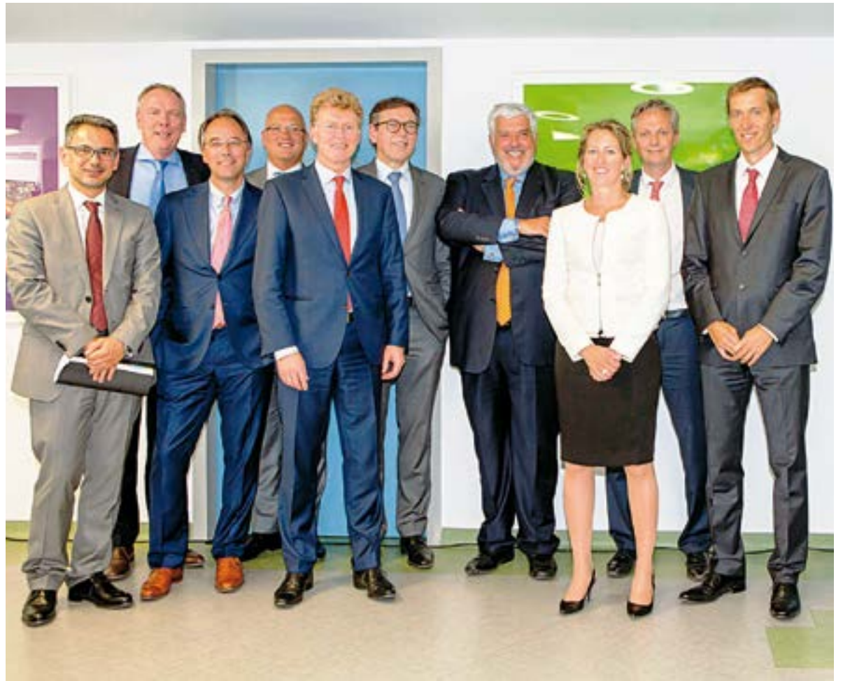
Τα ανώτατα στελέχη της Interamerican με τον πρόεδρο και τα μέλη του ΔΣ της Achmea

Ε πιβεβαιώνει η Interamerican όπως αναφέρει, την ικανή αποθεματοποίηση και φερεγγυότητα της με τη διανομή μερίσματος στους μετόχους της για τη χρήση 2015. Η πολιτική ανάπτυξης δραστηριοτήτων, οι διαχειριστικές πρακτικές και η έγκαιρη προσαρμογή στην κοινοτική οδηγία Solvency II, που αποτελεί πλέον νόμο από τις αρχές του 2016 με πιο χαρακτηριστικό παράδειγμα την εφαρμογή του Μερικού Εσωτερικού Μοντέλου για τις γενικές ασφάλειες, έχουν ισχυροποιήσει την οικονομική θέση της εταιρείας, παρά το δύσκολο οικονομικό περιβάλλον, προστίθεται στην ανακοίνωση. Συγκεκριμένα, το μέρισμα ανέρχεται σε 14,95 εκατ. ευρώ και οι μέτοχοι της Interamerican θα λάβουν καθαρό μέρισμα ανά μετοχή 0,11 ευρώ, με καταβολή από 1ης Σεπτεμβρίου. Επισημαίνεται ότι το 99,89% των μετοχών της Interamerican κατέχει η ολλανδική εταιρεία Achmea, ενώ το ελάχιστο υπόλοιπο είναι διεσπαρμένο σε ιδιώτες. Η Achmea δραστηριοποιείται, εκτός Κάτω Χωρών και Ελλάδος, και στις χώρες Τουρκία, Σλοβακία, Ιρλανδία καθώς και στην Αυστραλία, με πολιτική επίτευξης επικερδούς μεγέθυνσης και καινοτομίας, με τη χρήση των γνώσεων και της κεκτημένης εμπειρίας κυρίως στις γενικές ασφαλίσεις και την ασφάλιση υγείας.