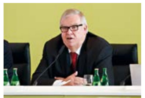
Ο Δρ. Paul-Otto Fassbender

Η ARAG SE – παλιά ARAG Allgemeine Rechtsschutzversicherungs AG – ως διαχειριστικά υπεύθυνη για τη χώρα της στρατηγικής του Ομίλου, ηγείται της ασφαλιστικής επιχείρησης νομικής προστασίας, τόσο σε εθνικό όσο και διεθνές επίπεδο.