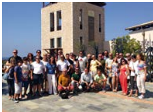
Στιγμιότυπο από το ταξίδι των συνεργατών στο Costa Navarino