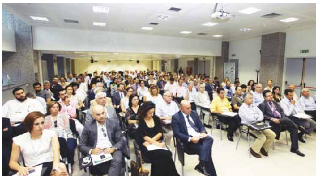
Μεγάλη συμμετοχή στις συναντήσεις

3. Τις νέες υπηρεσίες είσπραξης ασφαλίσεων, με ιδιαίτερη έμφαση στην αξιοποίηση της υπηρεσίας