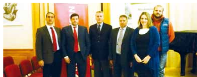
Η ομάδα των στελεχών και των ιατρών της Αθηναϊκής Mediclinic που συμμετείχαν στην εκδήλωση.

Η συνεργασία της Interamerican με την τοπική Αυτοδιοίκηση Τήνου, εκτός του πλαισίου της παροχής υπηρεσιών άμεσης ιατρικής βοήθειας και ειδικότερα αεροδιακομιδών στους κατοίκους του νησιού, διευρύνεται με πρόσθετες παροχές ενημέρωσης για την υγεία και κλινικών εξετάσεων από την Αθηναϊκή Mediclinic, γενική κλινική του ομίλου.