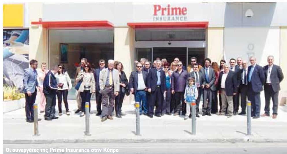
Οι συνεργάτες της Prime Insurance στην Κύπρο