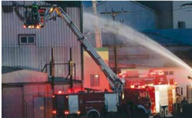
της επιχείρησης. Σε σύντομο χρονικό διάστημα και μετά από συνεννόηση και στενή συνεργασία με την διοίκηση της Creta Farm,

Ειδικότερα, με καταβολή σε πρώτη φάση του ποσού των 2.000.000€ οι ασφαλιστικές εταιρίες Groupama Φοίνιξ ΑΕΑΕ – leader του σχήματος συνασφάλισης με ποσοστό 34%, Εθνική ΑΕΕΓΑ με 30%, Ευρώπη ΑΕΓΑ με 14%, Generali Hellas ΑΑΕ με 12% και Αγροτική ΑΑΕ με 10%, οι οποίες ασφαλίζουν την ελληνική βιομηχανία τροφίμων στην Creta Farm, προκειμένου η εταιρεία να συνεχίσει τις δραστηριότητές της, μετά την πυρκαγιά που είχε εκδηλωθεί στις 14 Μαρτίου στις αποθήκες της και στη συνέχεια και λόγω του μεγάλου πυροθερμικού φορτίου εντός της αποθήκης, πήρε διαστάσεις πλήττοντας και διπλανό κτήριο