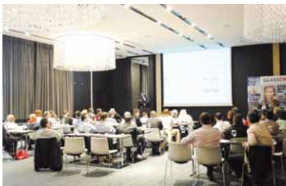
Στημιότυπο από το συνέδριο στη Θεσσαλονίκη

μείωση των νέων αδειών, η κατάθεση πινακίδων και η ολοένα λιγότερη κυκλοφορία των οχημάτων, καταφέραμε να αυξήσουμε σημαντικά το μερίδιο αγοράς μας και να κερδίσουμε την εμπιστοσύνη των Ασφαλιστικών Εταιριών αθλή και γενικότερα των πελατών μας. Με επίκεντρο της φιλοσοφίας μας τον άνθρωπο ως πελάτη και ως επαγγελματία, εμείς στην Glassdrive® στοχεύουμε στη συνεχή αναβάθμιση των υπηρεσιών μας και στην εκπαίδευση των συνεργατών μας, ώστε να συνεχίσουμε να παρέχουμε υπηρεσίες υψηλών προδια-