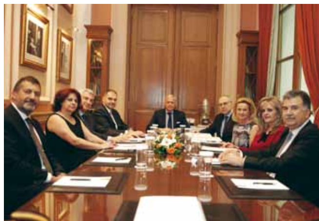
Το νέο ΔΣ στην Ευρώπη Ασφαλιστική

Ν έο διοικητικό συμβούλιο λόγω λήξης της θητείας του αποφάσισε η γενική συνέλευση των μετόχων της «ΕΥΡΩΠΗ ΑΣΦΑΛΙΣΤΙΚΗ». Το νέο Διοικητικό Συμβούλιο, του οποίου η θητεία είναι τριετής, συγκροτήθηκε σε σώμα στην πρόσφατη συνεδρίασή του και όρισε τα εκτελεστικά και μη εκτελεστικά μέλη του ως ακολούθως: