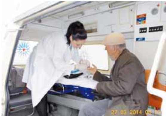
του Δήμου Δοξάτου ως απόδειξη της παρουσίας της με ειδικευμένο ιατρικό προσωπικό και ασθενοφόρο του Ομίλου «INTERΣΑΛΟΝΙΚΑ».

Ως πρώτη προτεραιότητα έχεις ο όμιλος «INTERΣΑΛΟΝΙΚΑ» την φροντίδα του ανθρώπου ανεξάρτητα εάν πρόκειται για πελάτη, ασφαλισμένο ή όχι και αποδεικνύει έμπρακτα πόσο κοντά βρίσκεται στους κατοίκους, απομακρυσμένων περιοχών και σε χωριά, φροντίζοντας εκείνους που δεν έχουν τη δυνατότητα να επισκεφτούν κέντρα υγείας ή μικροβιολογικά εργαστήρια για προληπτικό έλεγχο. Στο πλαίσιο της εταιρικής κοινωνικής ευθύνης, για ακόμη μία φορά ευαισθητοποιήθηκε και βρέθηκε στο χωριό Άγιος Αθανάσιος της Δράμας, δίνοντας την ευκαιρία στους κατοίκους να κάνουν προληπτικό έλεγχο και να ενημερωθούν σχετικά με την υγεία τους. Σε συνέχεια της προσπάθειας αυτής ο όμιλος έλαβε την ευχαριστήρια επιστολή