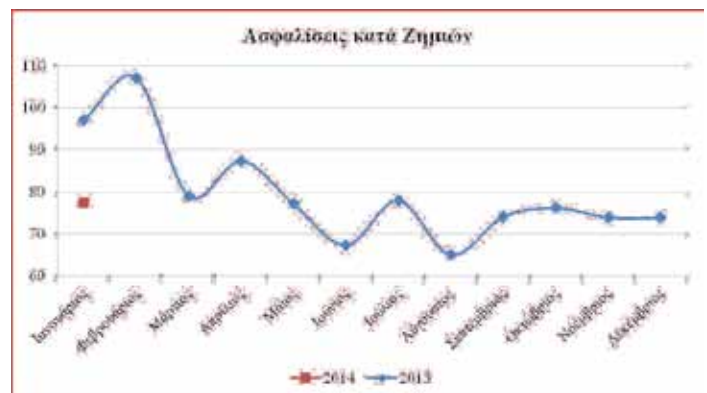
Παραγωγή ασφαλιστρων 2013 - 2014