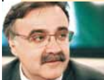
Του Λάμπρου Καραγεώργου

Πριν τρία χρόνια ο πρόεδρος του Επικουρικού Κεφαλαίου Δημήτρης Ζορμπάς πρότεινε να μεταφερθεί στο Επικουρικό Κεφάλαιο το Κέντρο Πληροφοριών προκειμένου έτσι όλος ο ασφαλισμένος στόλος των αυτοκινήτων να είναι κάτω από ένα έλεγχο.