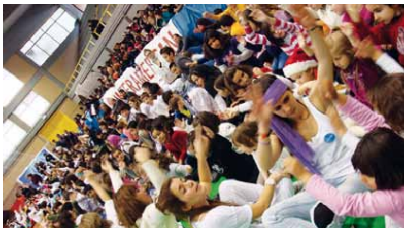
Στιγμιότυπο από τη διαπολιτισμική γιορτή της UNICEF.

Interamerican: Αποτελεσματική η συνεργασία με την Hellenic Seaways