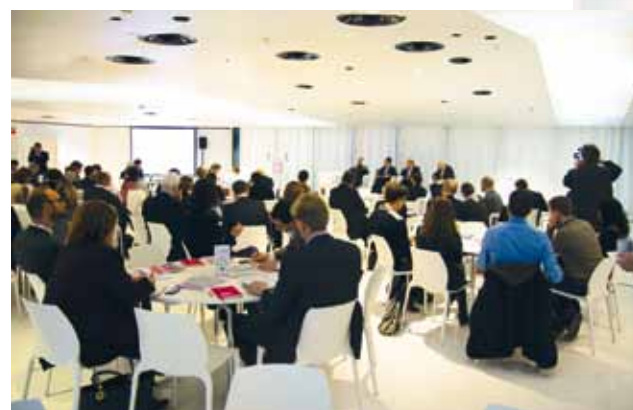
Πάνω, στιγμιότυπο από την εκδήλωση, δεξιά, η Nadja Hirsch MEP European Parliament, κάτω, ο κ.Σπύρου με τον Max Von Abendroth executive Director EMMA

Στις Βρυξέλλες πραγματοποιήθηκαν οι εργασίες του Συνεδρίου με θέμα «The Future of Content: Innovations in Content Creation, Dissemination and Consumption» στα πλαίσια του Future Media Lab, που διοργανώνει η EMMA (European Magazine Media Association). Ειδικότερα, στο επίκεντρο των εργασιών βρίσκεται το μέλλον των MME και πώς οι εκδότες βλέπουν το μέλλον αυτό καθώς και οι ευκαιρίες και οι απειλές που δημιουργεί η τεχνολογία. Από πλευράς της Ένωσης Δημοσιογράφων Ιδιοκτητών Περιοδικού Τύπου (ΕΔΙΠΤ) συμμετέχει ο Υπεύθυνος Δημοσίων Σχέσεων της Ένωσης, Κωστής Σπύρου. Το συνέδριο παρακολούθησαν σχεδόν 200 εκδότες από όλη την Ευρώπη αλλά και εκπρόσωποι του Ευρωκοινοβουλίου. Το συνέδριο τίμησε με τη παρουσία της και η Ευρωβουλευτής Nadja Hirsch κάνοντας αναφορά στο μέλλον των media στην Ευρώπη.