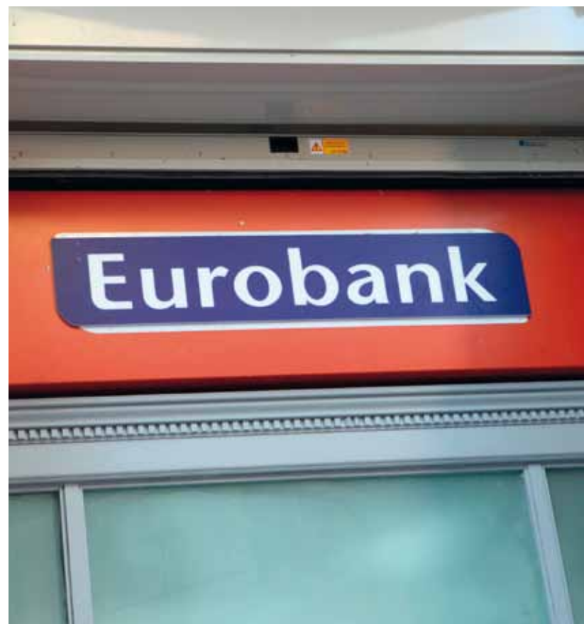
Του Χρήστου Κίτσιου

Άγριος, και υπόγειος πόλεμος βρίσκεται σε εξέλιξη εδώ και μερικές ημέρες με αντικείμενο την τύχη της Eurobank και το μέλλον του εγχώριου τραπεζικού συστήματος. Όπως είναι γνωστό το Μνημόνιο προβλέπει ότι η Eurobank θα πρέπει να ιδιωτικοποιηθεί ως τον προσεχή Απρίλιο καθώς αποτέλεσε τη μόνη συστημική τράπεζα που δεν κατόρθωσε να ανακεφαλαιοποιηθεί πέρυσι τον Μάιο με συμμετοχή ιδιωτών και έκδοση CoCos.