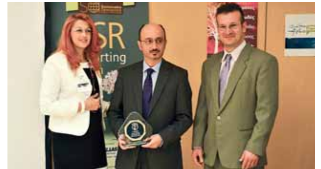
Ο Απολογισμός ΕΚΕ της Interamerican αξιολογείται στην τρίτη θέση σε επίδοση δεικτών κατά GRI-G3.1, στο σύνολο των Απολογισμών στην Ελλάδα.