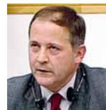
Ο κ. Μπενουά Κερέ

Την ανάγκη να αναλάβει η Ευρωπαϊκή Κεντρική Τράπεζα τον ρόλο ενός ανεξάρτητου επίσημου ελεγκτή των τραπεζών στην Κύπρο, τονίζει το μέλος του εκτελεστικού συμβουλίου της ΕΚΤ Μπενουά Κερέ στον ραδιοφωνικό σταθμό Europe 1. Το πρώτο μάθημα είναι ότι χρειαζόμαστε καλύτερο έλεγχο των τραπεζών. Χρειαζόμαστε μια ανεξάρτητη ευρωπαϊκή ρυθμιστική αρχή και αυτό θα συμβεί στα μέσα του 2014 και το ρόλο αυτό θα αναλάβει η ΕΚΤ και εμείς θα πρέπει να εντοπίζουμε τα προβλήματα νωρίτερα στην Ευρώπη», είπε χαρακτηριστικά ο Μπενουά Κερέ και διαφώνησε με την άποψη του επικεφαλής του Eurogroup, Γερούντ Ντάισελμπλουμ, ότι η διάσωση της Κύπρου αντιπροσωπεύει ένα νέο μοντέλο αντιμετώπισης των τραπεζικών κρίσεων στη νομισματική ένωση.