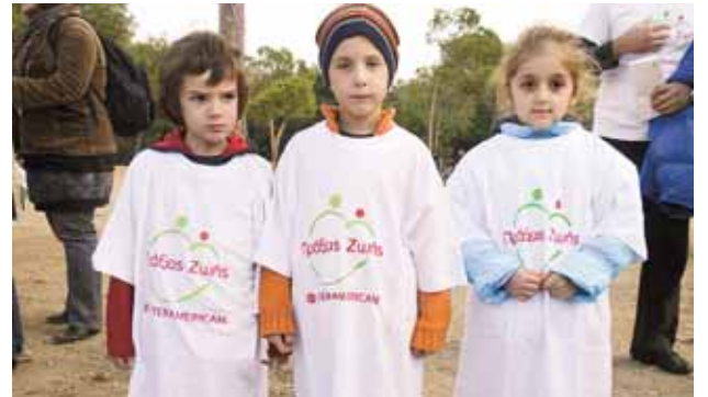
Στον εθελοντισμό μιλούν και τα παιδιά των εργαζομένων, συμμετέχοντας στις δράσεις της Εταιρείας.

ζαζομένων και συνεργατών, με έμφαση στην υγεία και παράλληλα, η ανάπτυξη της εθελοντικής συνεισφοράς τους για την προσθήκη αξίας στις αναλαμβανόμενες πρωτοβουλίες και την ενδυνάμωση της εταιρικής κουλτούρας για την υπευθυνότητα