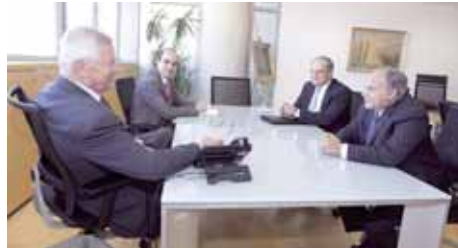
Από τη συνάντηση στα κεντρικά γραφεία της Εθνικής Ασφαλιστικής