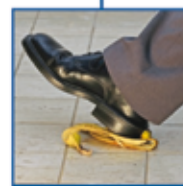
ασφάλειες αστικής ευθύνης