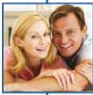
ασφάλειες ζωής & σύνταξης MINETTA Life