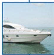
ασφάλειες πλοίων & σκαφών αναψυχής