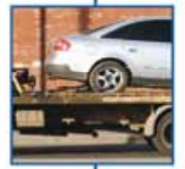
οδική βοήθεια MINETTA INTERPARTNER ASSISTANCE