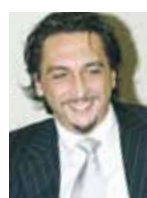
Ο Carlo Cimbri, διευθυνών σύμβουλος του Unipol Group

Σύμφωνα με ανακοίνωση που εξέδωσε η Unipol την 13η Ιανουαρίου 2012, συνεργάτης μεταξύ των Unipol Assicurazioni και οικογένειας Ligresti, ιδιοκτήτες της Premafin, Milano Assicurazioni και Fondiaria, μία μη δεσμευτική «Επιστολή προθέσεων», σύμφωνα με την οποία η Unipol δήλωνε την πρόθεσή της να συζητήσει ένα πιθανό πλάνο που θα οδηγούσε στη συγχώνευση των εν λόγω εταιρειών, στοχεύοντας στη δημιουργία του μεγαλύτερου ιταλικού ασφαλιστικού ομίλου στον κλάδο γενικών ζημιών και τον δεύτερο στις ασφάλειες ζωής. Εξέφρασε, επίσης, την πεποίθηση, ότι η συγχώνευση θα «έσωζε» τις εταιρείες του ομίλου Ligresti, που αντιμετώπιζαν πρόβλημα φερεγγυότητας, ενώ ο νέος αυτός όμιλος θα ήταν ικανός να ανταγωνιστεί μεγάλες ασφαλιστικές εταιρείες, όχι μόνο σε εθνικό αλλά