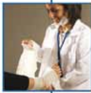
ασφάλειες προσωπικού ατυχήματος