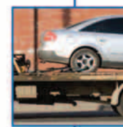
οδική βοήθεια MINETTA INTERPARTNER ASSISTANCE