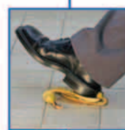
ασφάλειες αστικής ευθύνης