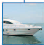
ασφάλειες πλοίων & σκαφών αναψυχής