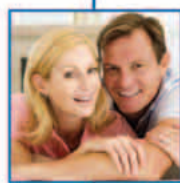
ασφάλειες ζωής & σύνταξης MINETTA Life