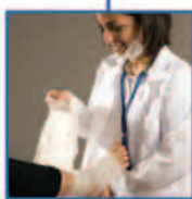
ασφάλειες προσωπικού ατυχήματος