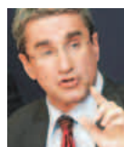
Ο κ. Ανδρέας Λοβέρδος

Μείωση της τιμής κατά 92% επιτεύχθηκε στην πρώτη ηλεκτρονική δημοπρασία του Νοεμβρίου για τα νοσοκομειακά φάρμακα. Συγκεκριμένα, όπως αναφέρεται σε ανακοίνωση του υπουργείου Υγείας, ολοκληρώθηκε η δημοπρασία για την προμήθεια όλων των νοσοκομείων της χώρας με την ουσία σιπροφλοξανίνη (δραστικό αντιβιοτικό χωρίς εμπορική ονομασία), για την οποία η προϋπολογισθείσα δαπάνη ήταν 5.200.000 ευρώ και μέσω