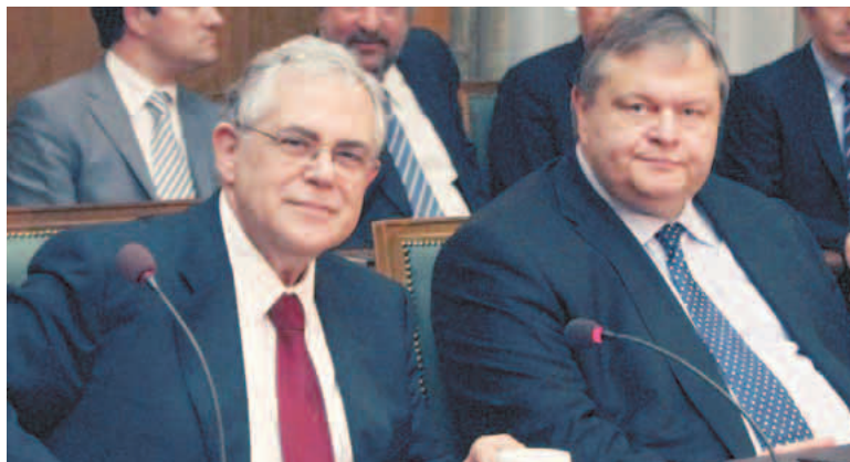
Με δεδομένο ότι ο νέος πρωθυπουργός είχε ταχθεί κατά του μεγαλύτερου κουρέματος του ελληνικού χρέους, οι ελπίδες να περάσει η πρόταση του ΙΙΦ για διαφορετικές ταχύτητες κουρέματος αυξάνονται

Το ΙΙΦ έχει καταρτίσει, σύμφωνα με όσα αποκάλυψε ο κ. Βενιζέλος σε ένα από τα τελευταία υπουργικά συμβούλια της απελθούσας κυβέρνησης, σχέδιο κουρέματος το οποίο πλησιάζει στην πρόταση που είχε υποβάλει η Ένωση Ελληνικών Τραπεζών (ΕΕΤ).