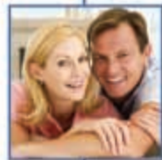
ασφάλειες ζωής & σύνταξης MINETTA Life