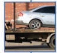
οδική βοήθεια MINETTA INTERPARTNER ASSISTANCE