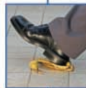
ασφάλειες αστικής ευθύνης