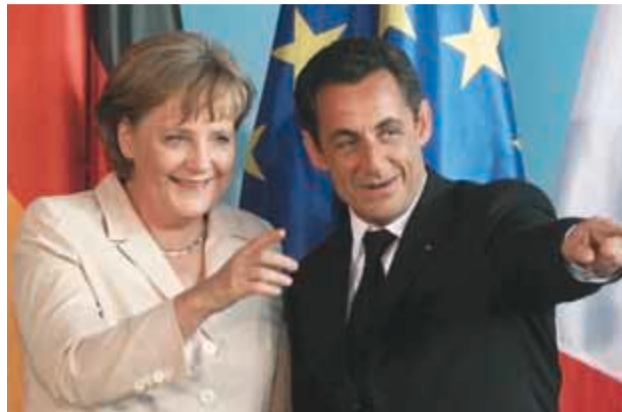
Γερμανοί και Γάλλοι επιδιώκουν να δώσουν ανάσα στις υπερχρεωμένες χώρες της Ευρωζώνης, μέσω του Μόνιμου Μηχανισμού Στήριξης

Πρόκειται για μια απλή στη σύλληψή της ιδέα, που συνιστά όμως και μια τεράστια πολιτική στροφή, σχολιάζει στέλεχος της αγοράς ομολόγων. «Γερμανοί και Γάλλοι “εκβιάζουν” τις αγορές να συμμετάσχουν στο κόστος αναδιάρθρωσης του χρέους, πουλώντας τους ως αντάλλαγμα τη σιγουριά ενυπόθηκων δανείων». Πρόκειται για ένα τεράστιο στοίχημα με σκληρό αντίτιμο, καθώς εκτινάσσει το risk premium χωρών με υψηλό δημοσιονομικό έλλειμμα, χρέος και ύφεση όπως οι