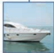
ασφάλειες πλοίων & σκαφών αναψυχής