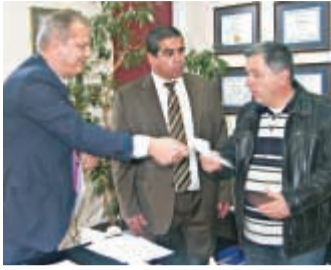
Στιγμιότυπο από την επίδοση επιταγής σε πελάτη.

Ε κτεταμένες ζημιές σε περιουσιακά στοιχεία στη Χίο άφησαν πίσω τους τα έντονα καιρικά φαινόμενα που έπληξαν το νησί τον Οκτώβριο.