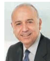
Ο διευθύνων σύμβουλος & CEO της Allianz Ελλάδος κ. Πέτρος Παπανικολάου

Σε ό,τι αφορά ειδικότερα την παραγωγή των προϊόντων προστασίας, σύνταξης και αποταμίευσης, αυξήθηκε κατά 9,5%, ενώ αντίστοιχα κατά 2,6% αυξήθηκε η παραγωγή σε προϊόντα υγείας και ατυχημάτων.