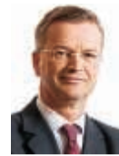
Ο κ. Werner Zedelius

καμε αξιόπιστοι συνεργάτες ιστάμενοι στο πλευρό των πελατών μας την ώρα της ανάγκης», σχολίασε σχετικά ο Werner Zedelius, μέλος του διευθυντικού συμβουλίου της Allianz SE, υπεύθυνος για την ανάπτυξη των αγορών. Αξίζει να σημειωθεί ότι όσον αφορά τον ασφαλιστικό τομέα ιδιοκτησίας και ζημιών τα εγγεγραμμένα μεικτά ασφαλιστρα για τους πρώτους εννέα μήνες