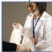
ασφάλειες προσωπικού ατυχήματος