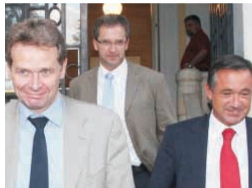
Η Τρόικα δείχνει να αποδέχεται την ελληνική πρόταση για αύξηση κεφαλαίου της ΑΤΕ, στην οποία το Δημόσιο θα βάλει «ζεστό» χρήμα.

«Η υπόθεση θυμίζει τις περσινές διαπραγματεύσεις κυβέρνησης - Κομισιόν για τα δημοσιονομικά μέτρα που έπρεπε να λάβει η Ελλάδα» αναφέρει στέλεχος που παρακολουθεί εκ του σύνεγγυς τις εξελίξεις. Η κυβέρνηση ζητά από την