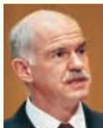
Ο κ. Γ. Παπανδρέου

Την αισιοδοξία του ότι ως το 2013 θα έχει ολοκληρωθεί η διαδικασία του μνημονίου εξέφρασε ο πρωθυπουργός στην συνέντευξη Τύπου, στο πλαίσιο της ΔΕΘ, τονίζοντας ταυτόχρονα ότι «όσο πηγαίνουμε καλά, δεν χρειάζονται νέα μέτρα και νέο μνημόνιο». Για το θέμα της εξίσωσης των φόρων πετρελαίου θέρμανσης και κίνησης, ο κ. Παπανδρέου είπε ότι δεν θα υπάρξει, όσο δεν υπάρχει μηχανισμός αναδιανομής, για τις αυξήσεις στη ΔΕΗ σημείωσε πως δεν θα επιβαρυνθούν τα μεσαία και χαμηλότερα εισοδηματικά στρώματα και διέψευσε τα σενάρια για νέες περικοπές στους μισθούς. Επισήμανε ότι η αναδιάρθρωση του χρέους θα ήταν καταστροφική για την οικονομία, με πιθανή κατάρρευση του τραπεζικού συστήματος και ανακοίνωσε ότι αναλαμβάνει αμισθί ο τέως αντιπρόεδρος της Ευρωπαϊκής Κεντρικής Τράπεζας και πρώην διοικητής της Τράπεζας της Ελλάδος, Λουκάς Παπαδήμος σε ρόλο συμβούλου. Το περιστατικό με το παπούτσι που πέταξε εναντίον του δυσαρεστημένος πολίτης, το χαρακτήρισε «περίεργο», κάνοντας λόγο ακόμα και για κατασκευασμένα γεγονότα, με στόχο να αμαυρώσουν την εικόνα της Ελλάδας.