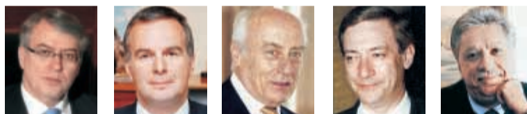
Κλειδί για τη διάταξη του τραπεζικού συστήματος είναι η απόφαση για το Τ.Τ.

Κ ομβικό ρόλο για τη νέα διάταξη του τραπεζικού χάρτη έχει πλέον η τύχη του Ταχυδρομικού Ταμειυτηρίου, καθώς η απόφαση της Εθνικής να ενισχυθεί κεφαλαιακά κατά 2,8 δισ. ευρώ εξασφαλίζει ρευστότητα για ενίσχυση της αγοράς και απελευθερώνει τις αποφάσεις της κυβέρνησης για