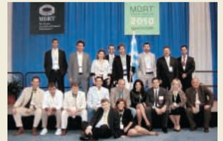
Η ομάδα των ασφαλιστικών συμβούλων-μελών του MDRT στο φετινό παγκόσμιο συνέδριο του οργανισμού στο Βανκούβερ.

Σημειώνεται ότι το περιφερειακό συνέδριο MDRT Europe του 2011, τον Φεβρουάριο, θα φιλοξενηθεί στην Αθήνα.