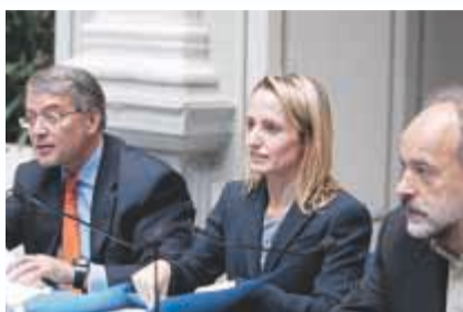
Απόστολος Ταμβακάκης, Τίνα Μπιρμπίλη και Γιάννης Αλαβάνος στη συνέντευξη Τύπου

Εκατό χιλιάδες νοικοκυριά εκτιμάται ότι θα συμμετάσχουν στο χρηματοδοτικό πρόγραμμα της Εθνικής Τράπεζας και του ΤΕΕ για την ενεργειακή αναβάθμιση κτηρίων, που προωθεί το υπουργείο Περιβάλλοντος και στο οποίο μπορούν να ενταχθούν και οι μηχανικοί, ώστε να εξασφαλίσουν τα απαραίτητα κεφάλαια κίνησης για την υλοποίηση των εργασιών που αναλαμβάνουν. Το πρόγραμμα αφορά στη χορήγηση δανείων από την Εθνική Τράπεζα με εγγύηση του ΤΣΜΕΔΕ. Οπως διευκρίνισε σε συνέντευξη Τύπου ο διευθύνων σύμβουλος της Εθνικής Τράπεζας, Απόστολος Ταμβακάκης, παρουσία της υπουργού Περιβάλλοντος Ενέργειας και Κλιματικής Αλλαγής, Τίνας Μπιρμπίλη, και του προέδρου του Τεχνικού Επιμελητηρίου Ελλάδος (ΤΕΕ), Γιάννη Αλαβάνου, το επιτόκιο χορήγησης αυτών των δανείων θα είναι χαμηλότερο από τα τρέχοντα κατά μία ως τρεις μονάδες, ανάλογα με το είδος του δανείου, καταναλωτικό ή επισκευαστικό. Με την Εθνική Τράπεζα υπάρχει μια συνεργασία από το 1956, είπε ο κ. Αλαβάνος, σημειώνοντας ότι γίνονται αποδεκτές προτάσεις διέυρυνσης και αναβάθμισης της συνεργασίας αυτής προς όφελος όχι μόνο των μηχανικών, αλλά της κοινωνίας που περιμένει αγωνιωδώς τρόπους και προτάσεις διεξόδου. Η κ. Μπιρμπίλη γνωστοποίησε ότι πιθανότατα μέσα στον Ιούνιο θα ξεκι-