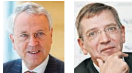
Ο κ. Jan Hommen και ο κ. Bram Boon.

Η στρατηγική διαχωρισμού ασφαλιστικών και τραπεζικών δραστηριοτήτων ήταν επιβεβλημένη, καθώς -όπως αναφέρει ο Jan Hommen, CEO του ING Group- «οι περισσότεροι από τους ανταγωνιστές μας είτε έχουν αποχωρήσει ή έχουν συρρικνώσει σημαντικά έναν από τους δύο πυ-