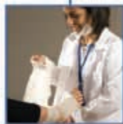
ασφάλειες προσωπικού ατυχήματος