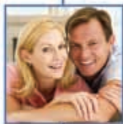
ασφάλειες ζωής & σύνταξης MINETTA Life