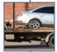
οδική βοήθεια MINETTA INTERPARTNER ASSISTANCE