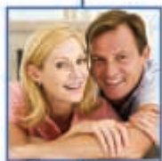
ασφάλειες ζωής & σύνταξης MINETTA Life