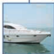
ασφάλειες πλοίων & σκαφών αναψυχής