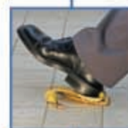
ασφάλειες αστικής ευθύνης