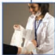
ασφάλειες προσωπικού ατυχήματος