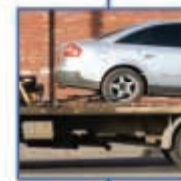
οδική βοήθεια MINETTA INTERPARTNER ASSISTANCE