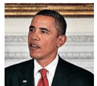
Τα σχέδια για τη μεταρρύθμιση της αγοράς θα δημιουργήσουν ένα σύστημα ασφαλέστερο από εκείνο που αντικαθιστά, δήλωσε ο Ομπάμα.

να αποσυρθούν σε περίπτωση δυσμενών αποδόσεων στο μέλλον. Επί πλέον, «ένα σημαντικό ποσοστό, πάνω από 50%» θα είναι με τη μορφή μετοχών ή αξιών που συνδέονται με μετοχές και θα υπόκεινται σε «ανάλογες πολιτικές επίσχεσης μετοχών». Τα υπόλοιπα θα είναι σε μορφή μετρητών που δίδονται βαθμιαία. Η Σύνοδος των 20 υιοθέτησε, επίσης, τις μεταρρυθμίσεις που εισηγήται το FSB για το χρηματοοικονομικό σύστημα, με στόχο την