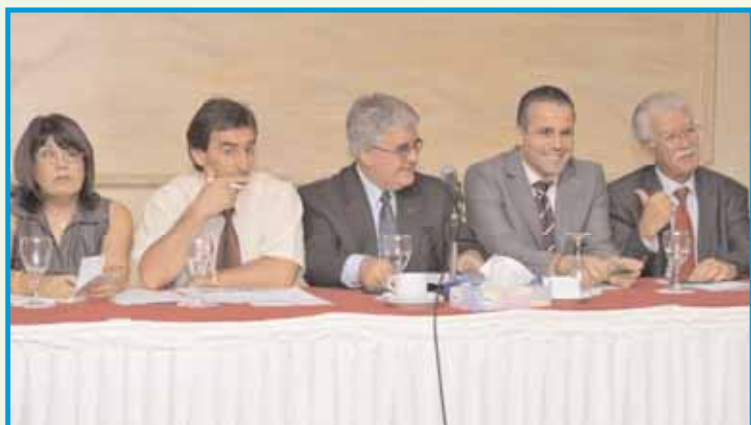
Οι ομιλητές της εκπαιδευτικής εκδήλωσης