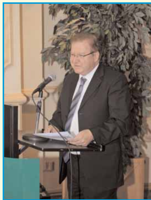
Χαιρετισμός από τον Γενικό Διευθυντή του Υπουργείου Εργασίας και Κοινωνικών Ασφαλίσεων κ. Γιώργο Παπαγεωργίου