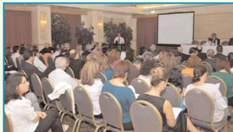
Το κοινό παρακολουθεί με ενδιαφέρον τα θέματα της εκπαιδευτικής εκδήλωσης