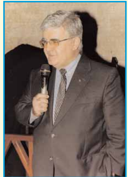
Ο Πρόεδρος του Ασφαλιστικού Ινστιτούτου Κύπρου εύχεται σε όλους τους παρευρισκόμενους Καλές Γιορτές και Ευτυχισμένο το 2010

Οι εκπλήξεις της βραδιάς ήταν πολλές συμπεριλαμβανομένων των μεγάλων δώρων που κληρώθηκαν κατά τη διάρκεια της εκδήλωσης.