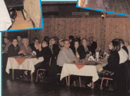
Στιγμιότυπα από το επίσιο χορευτικό δείπνο