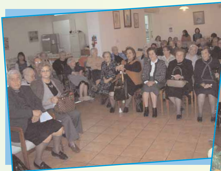
Σημειώσιμα από τους παρευρισκομένους