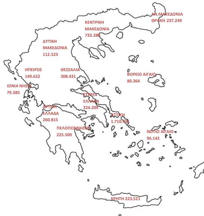
Χάρτης 1: Καταβολή Συντάξεων ανά Περιφέρεια

Στον Πίνακα 9 αποτυπώνονται τα ποσά σύνταξης που αντιστοιχούν σε κάθε Περιφέρεια σε σχέση με το αντίστοιχο ΑΕΠ για το έτος 2010 (προσωρινά στοιχεία ΕΛΣΤΑΤ). Σύμφωνα με τα δεδομένα του Πίνακα 9, στην Περιφέρεια Ηπείρου παρατηρείται η μεγαλύτερη τιμή (17,5%) του λόγου ποσού σύνταξης προς ΑΕΠ και ακολουθεί η Περιφέρεια Θεσσαλίας με τιμή 17,1%. Στην τελευταία θέση βρίσκεται η Περιφέρεια Νοτίου Αιγαίου με τιμή 7,8%.