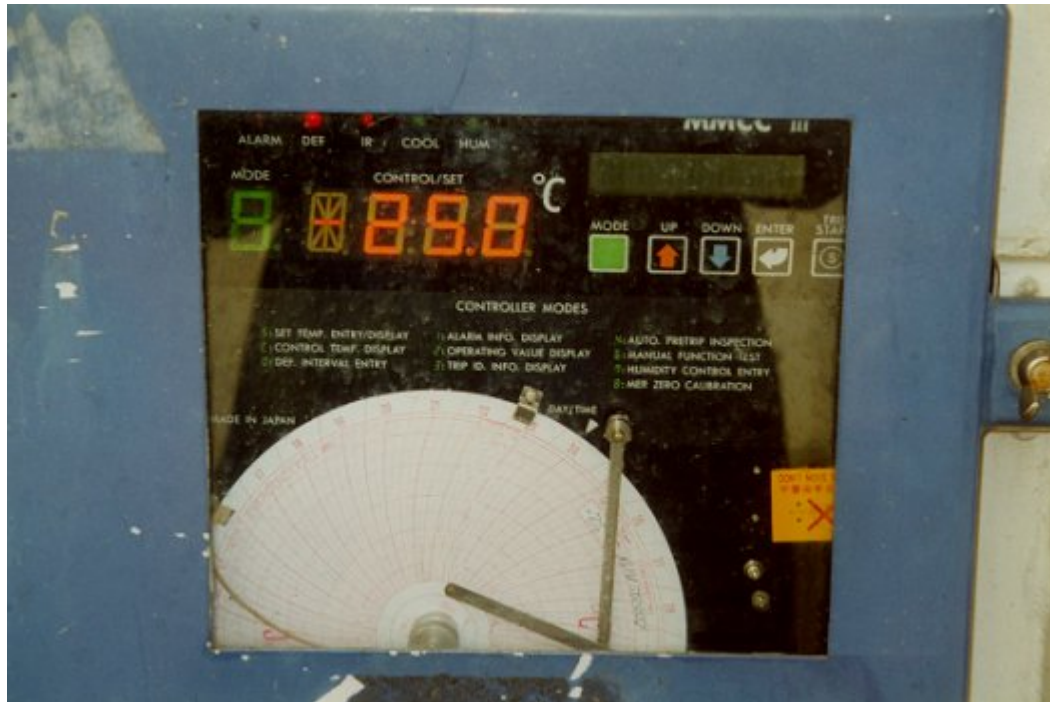
ΦΩΤΟ 2 : Temperature display on a refrigerated container with integral refrigeration unit (integral unit). The temperature is both indicated on the display and recorded on the Partlow recorder.