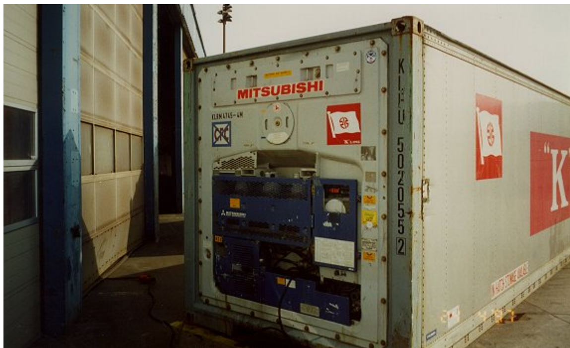
ΦΩΤΟ 4 : Integral unit (ΕΝΣΩΜΑΤΩΜΕΝΟ ΨΥΚΤΙΚΟ ΜΗΧΑΝΗΜΑ)