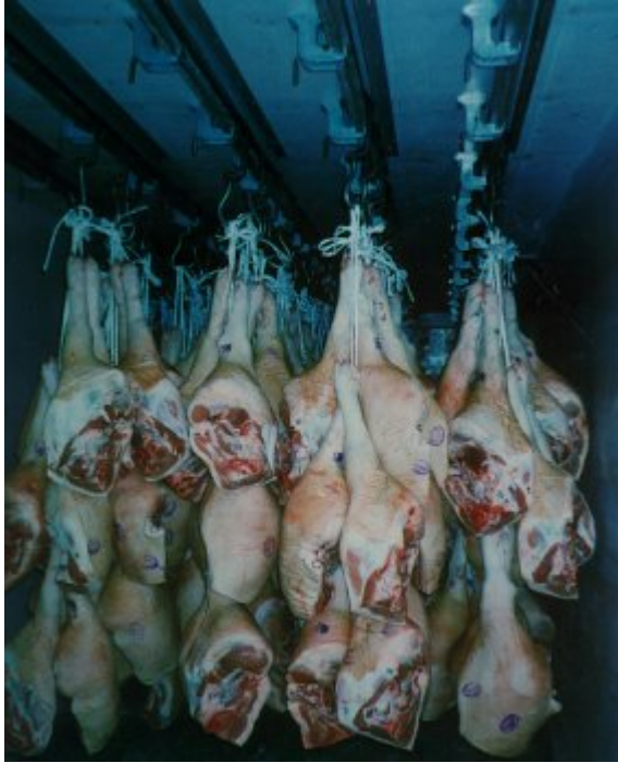
ΦΩΤΟ 6 : Transport of chilled meat in a container: this Figure shows the hook rails in the container roof. Hanging transport of chilled meat preserves the cargo from bruising and ensures proper circulation of cold air.