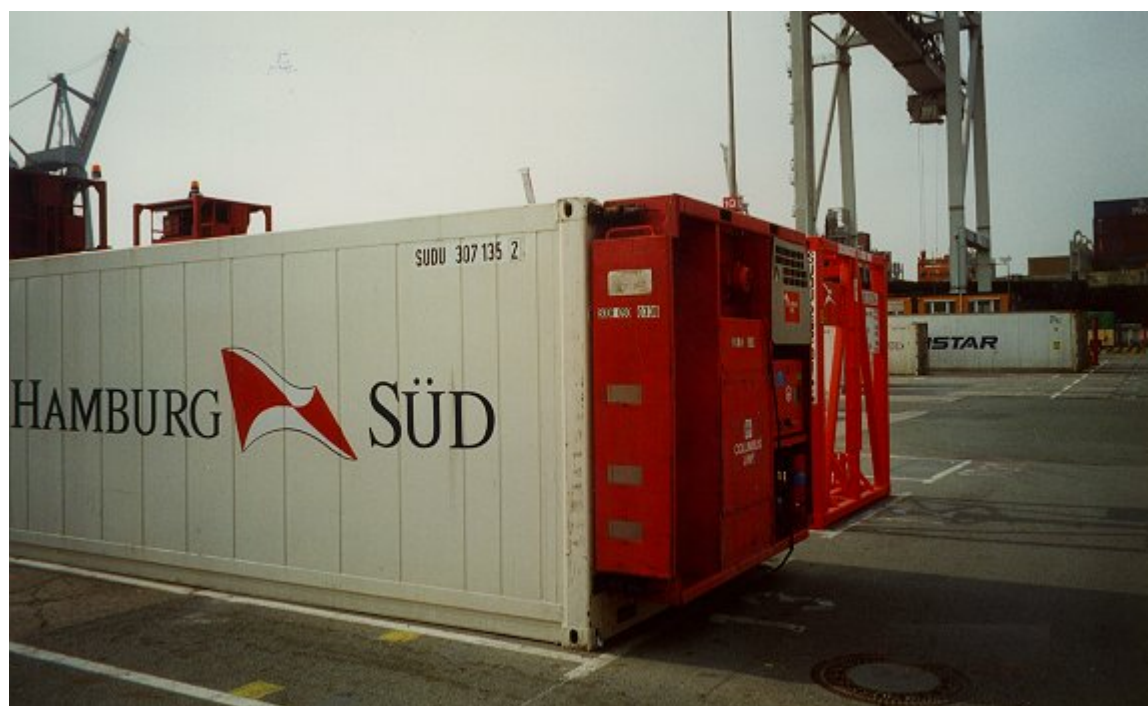
ΦΩΤΟ 5 : Porthole (INSULATED) container with attached "clip-on unit" for supplying cold air ashore